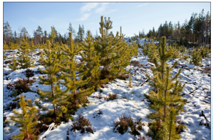
Kylvötulos S35.a:lla suoritetulla kylvöllä