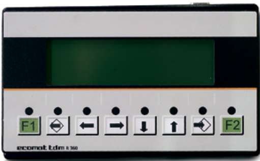
PLC-pohjainen, CAN-bus-tekniikkaa käyttävä Bracke Growth Control -ohjausjärjestelmä