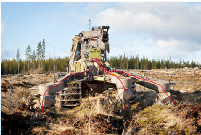
Bracke S35.a voidaan asentaa yksi-, kaksi- tai kolmirivisiin maanmuokkauslaitteisiin.