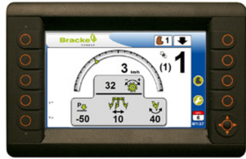
Bracke Growth Control on PLC-pohjainen ohjausjärjestelmä.