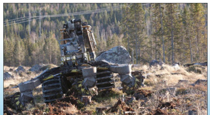
Bracke T35.b asennetaan suuriin metsäkoneisiin.