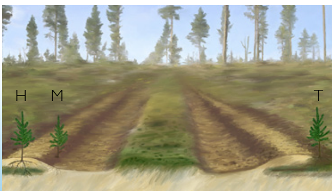
Bracke T35.b muodostaa istutuspaikat kaksinkerroin käännettystä kunnasta (T), kaksinkerroin käännettystä kunnasta ja kivennäismaasta (H) tai kivennäismaasta (M).